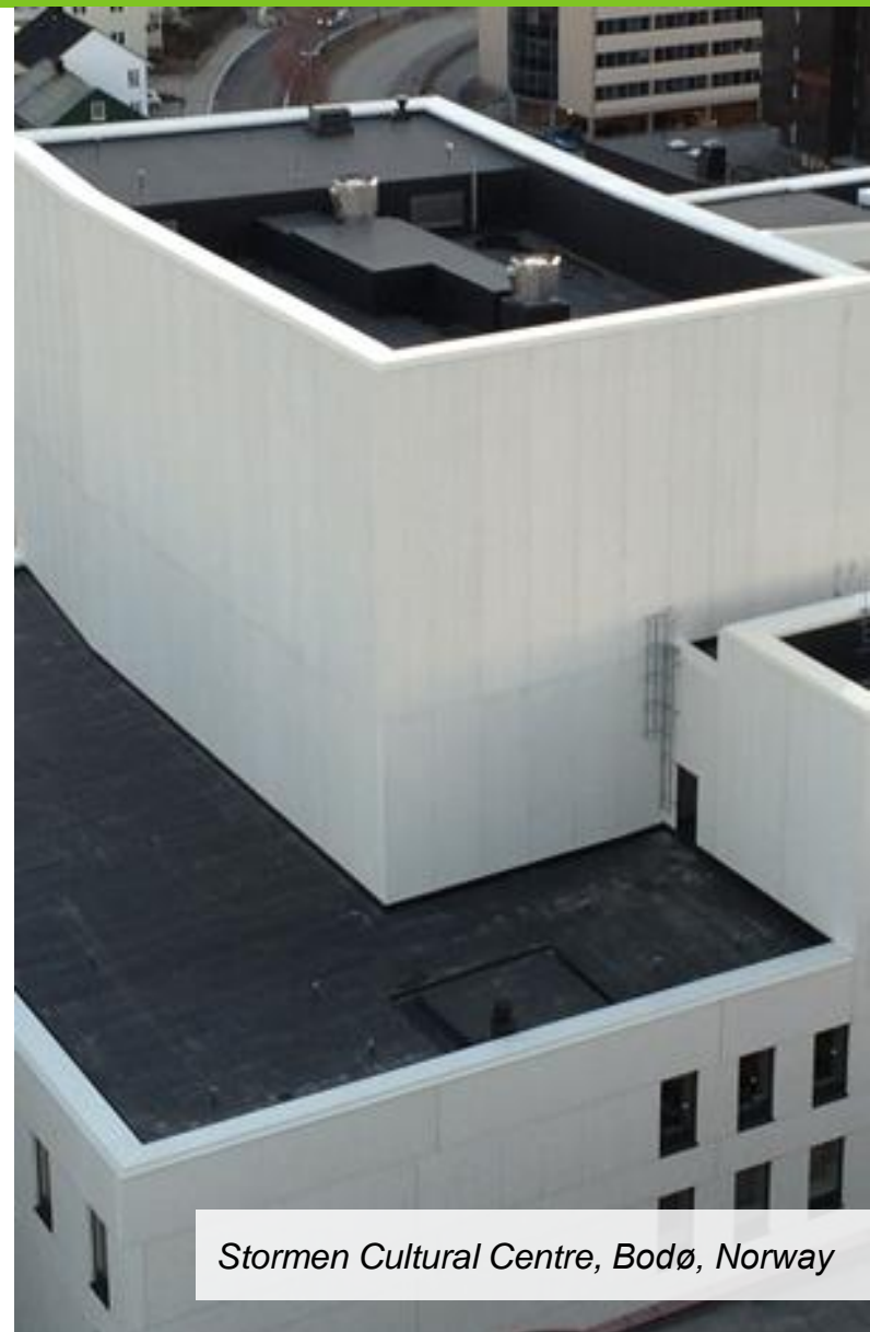
Stormen Cultural Centre, Bodø, Norway